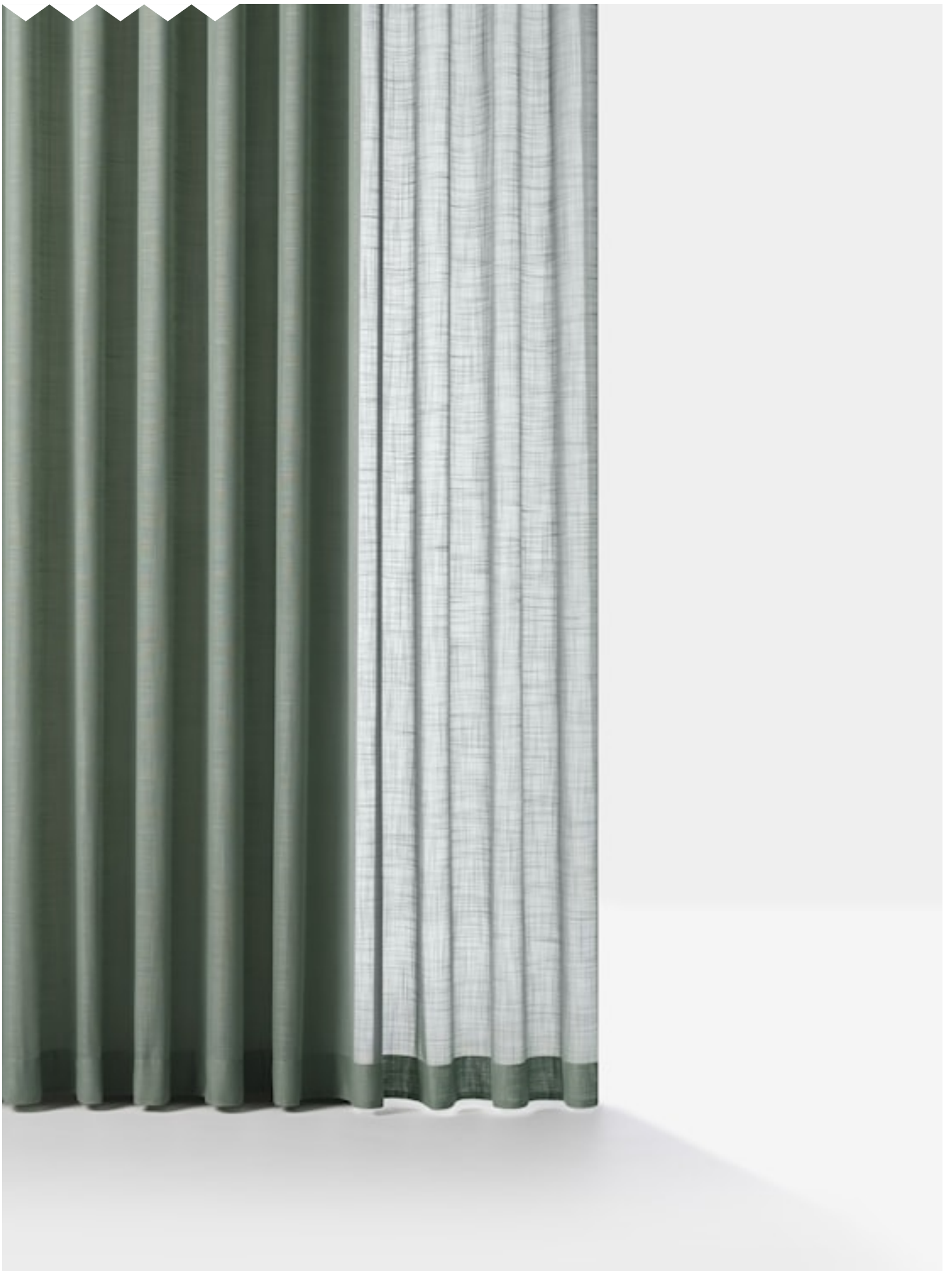
DAY Hängande textil